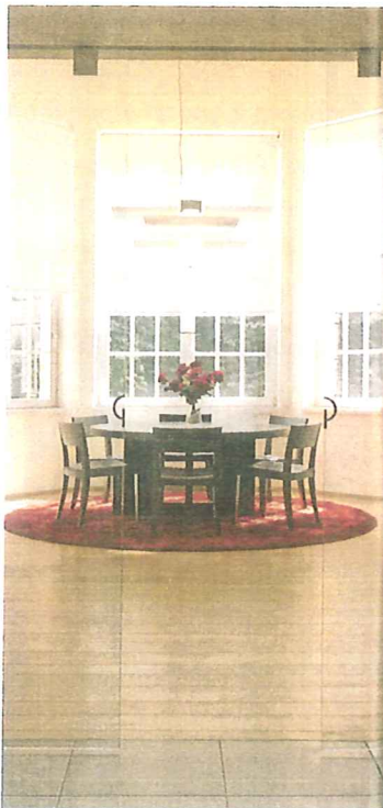
Espace repas. La suspension lumineuse a été créée par l'équipe d'Ingo Maurer.

(1) Hyde Park Uccle, Alice Editions, Bruxelles 2007.